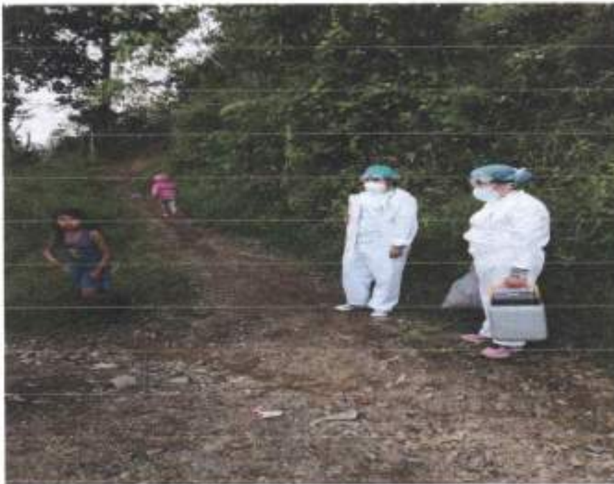
Se hizo entrega de volantes con el proceso de lavado de manos